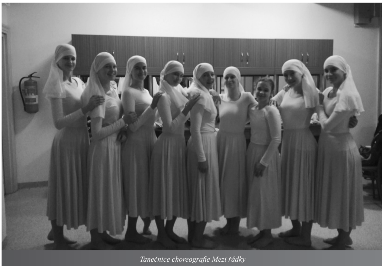
Tanečnice choreografie Mezi řádky