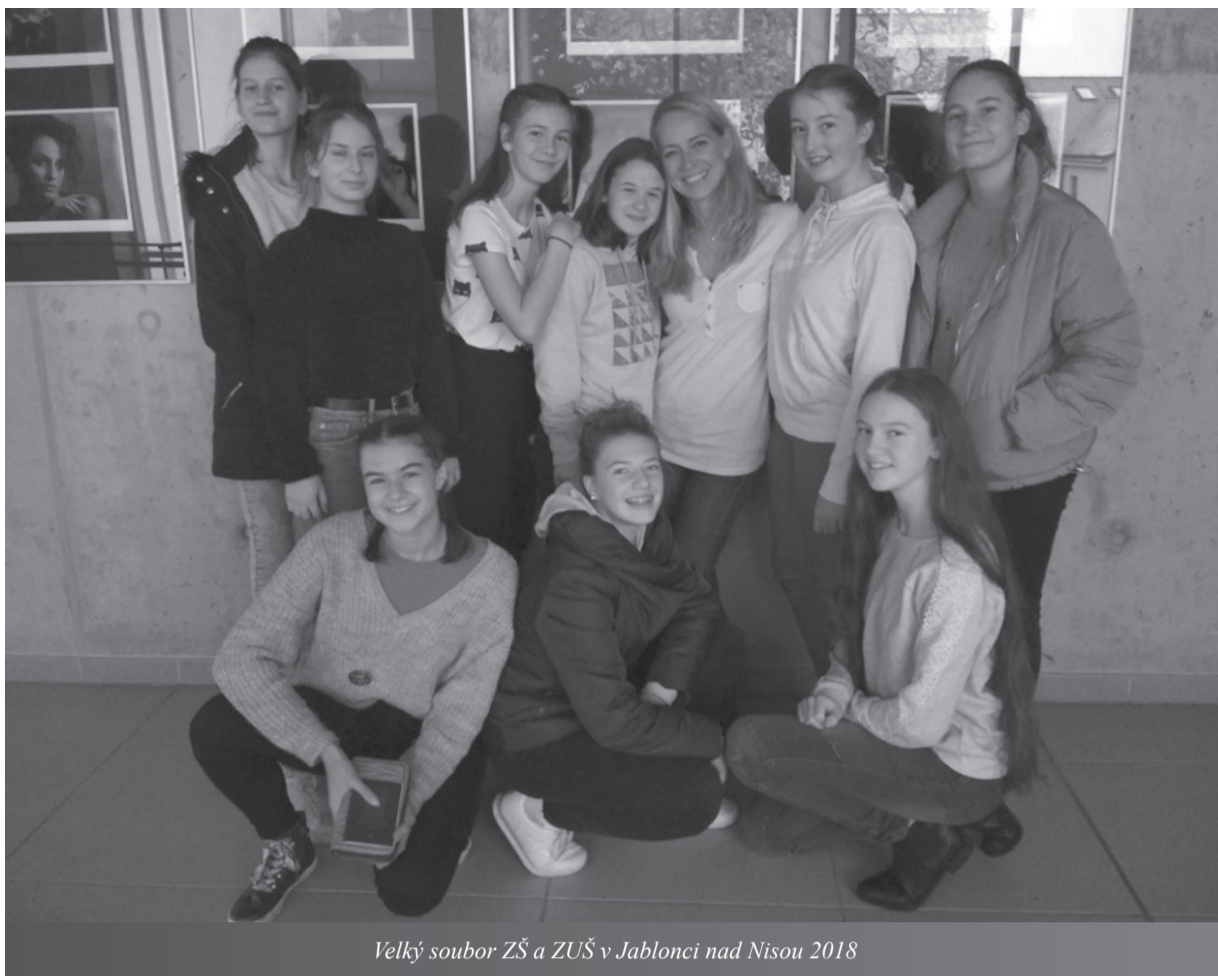
Velký soubor ZŠ a ZUŠ v Jablonci nad Nisou 2018