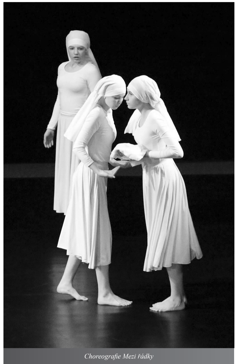
Choreografie Mezi řádky

Jablonce jsme musely zvládnout najít naše ubytování (což nebylo zase až tak lehké), stihnout včas workshop, udělat prostorovou a světelnou zkoušku v divadle a večer v neposlední řadě zatančit naše vystoupení, jak nejlépe umíme. Tento dlouhý den byl náročný, ale o to víc jsme se jako soubor sblížily a podporovaly jsme jedna druhou. Jsem na nás pyšná, na to jak nádherně všechny holky tančily a jak hravě zvládly tento den. V sobotu jsme si už jen užívaly skvělé workshopy a večerní vystoupení a v neděli jsme zhlédly krásné představení loňských vítězů Ceny města tance. Gratuluji letošním vítězům a už se těším na příští rok, čím nás překvapí.