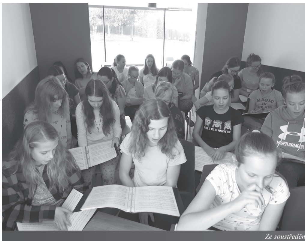
Ze soustředění pěveckých sborů