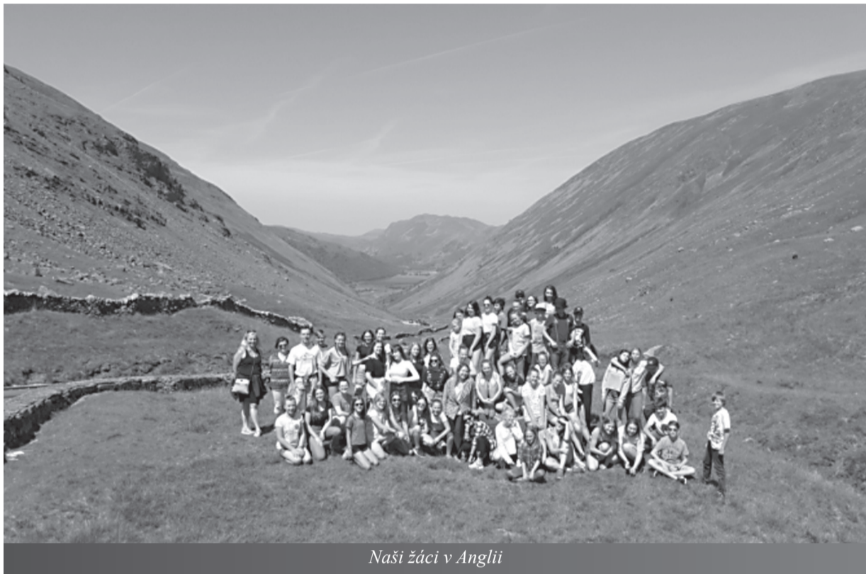
Naši žáci v Anglii