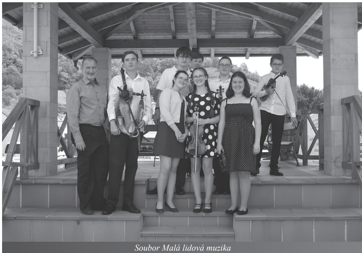
Soubor Malá lidová muzika