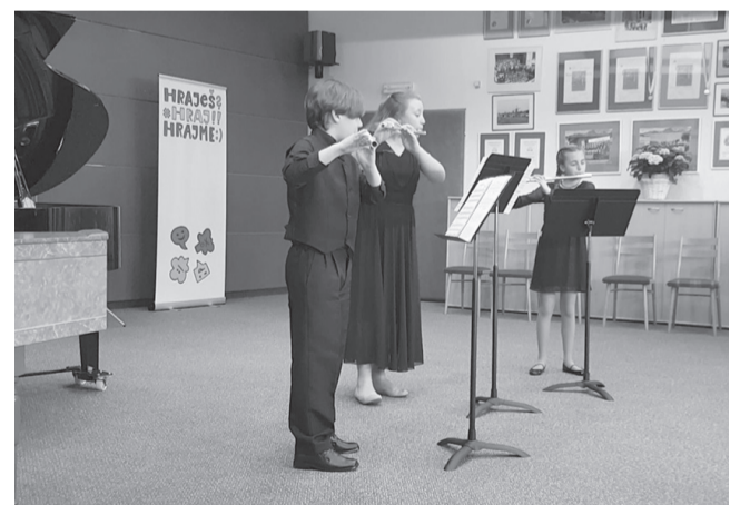
Flétnové trio na ústředním kole v Liberci