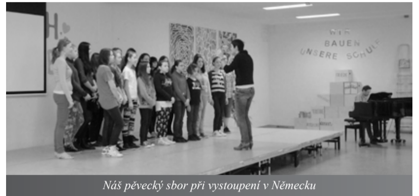
Náš pěvecký sbor při vystoupení v Německu