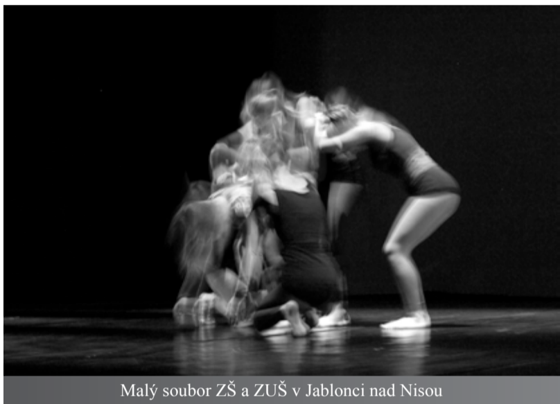
Malý soubor ZŠ a ZUŠ v Jablonci nad Nisou