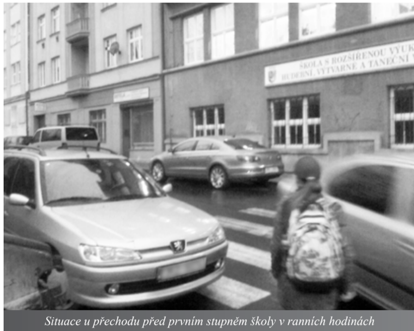
Situace u přechodu před prvními stupni školy v ranních hodinách