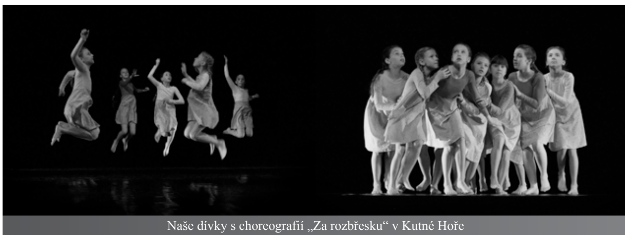
Naše dívky s choreografií „Za rozbřesku“ v Kutné Hoře