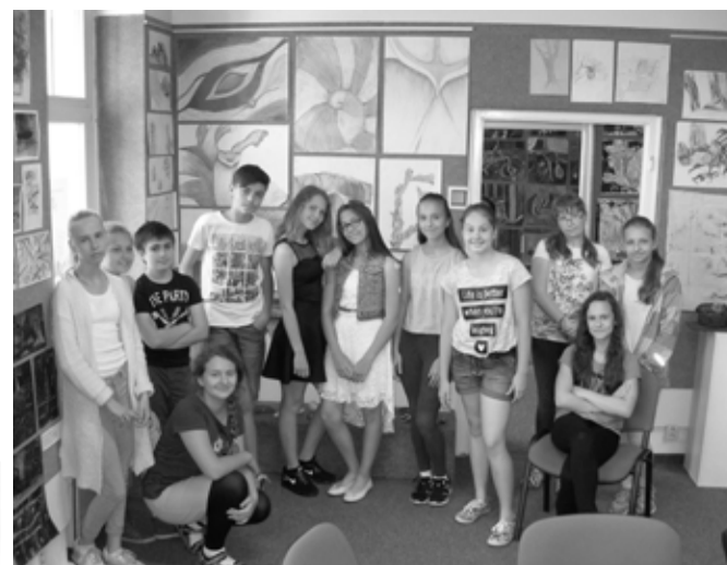
Jeden z instalačních týmů naší letní výstavy před svými kresbami