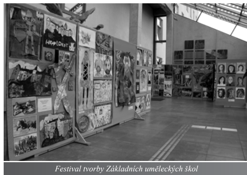
Festival tvorby Základních uměleckých škol