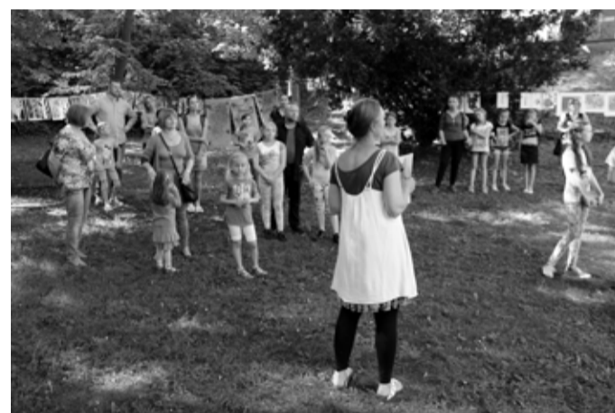
Letní výstava na téma Zahrada se konala nejen v galerii Duhová paleta, ale také přímo ve školní zahradě, která byla naší inspirací i atelierem