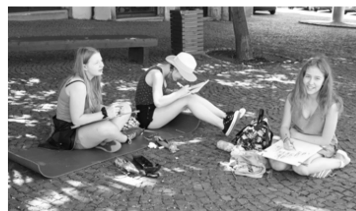
Výtvarný kurz v Chebu | Kresby a fotografie z výtvarného kurzu jsou k vidění v přízemí budovy Šmeralova 15

Krajská umělecká rada základních uměleckých škol Karlovarského kraje srdečně zve na